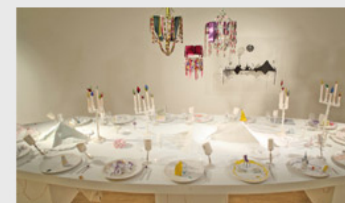
The Party (2010)

De kleine werkjes maakten plaats voor installaties en sculpturen. Van rustig en lieflijk gekleurd, veranderde haar werk in zwart. “Nee, niet depressief”, benadrukt ze. “Serieus. En écht. Voorheen was het doel van mijn werk een concept te visualiseren. Eerst kwam het concept, dan de rest. Ik maakte bijvoorbeeld een catalogus over zes internationale kunstenaars. Ik schreef biografieën over hen, en toonde foto's van hun werk. Het zag er allemaal heel mooi en echt uit, maar die kunstenaars bestonden helemaal niet. Het was allemaal fictie. De catalogus stuurde ik op als kerstcadeau naar 200 wereldberoemde curators. Ik wilde een statement maken over de manier waarop mensen met kunst omgaan. Ze zien een catalogus en praten over de expositie alsof ze erbij waren. In werkelijkheid hebben ze niets gezien.”