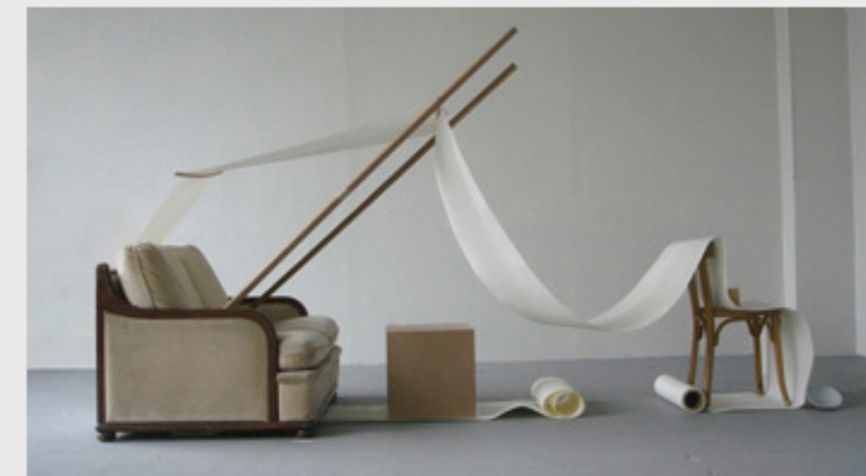
Caravane Cinéma (2007)