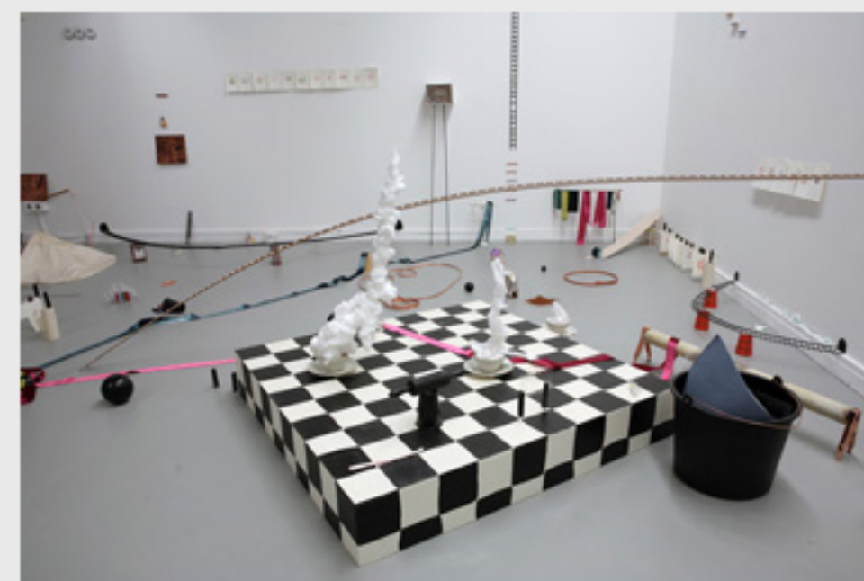
Winter Donut (2010)