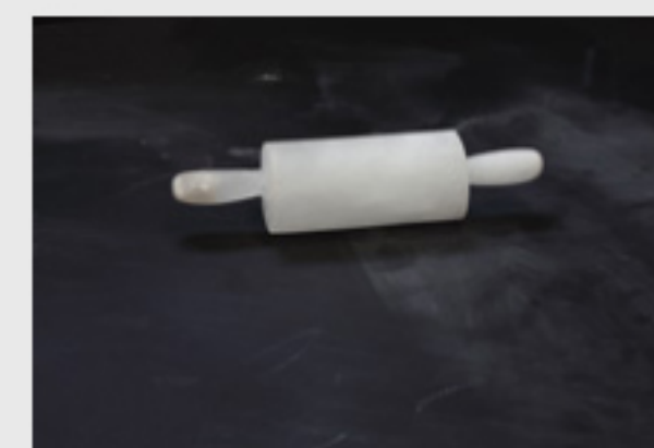
L'histoire de début du monde, jusqu'à la moitié (2011) 300 x 280 x 150 cm Albast, schoolbordverf