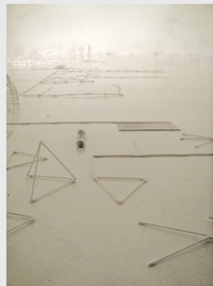
Coton-tiges architecture (2008)